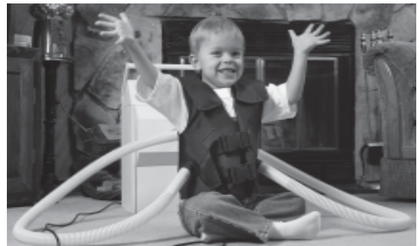
La oscilación de alta frecuencia de la pared torácica es el uso de un chaleco que vibra y ayuda a aflojar el moco de los pulmones.

La oscilación de alta frecuencia de la pared torácica también se conoce como Vest u Oscillator. Se conecta un chaleco inflable a una máquina que lo hace vibrar a alta frecuencia. El chaleco hace vibrar el tórax para aflojar y arralar el moco. Cada cinco minutos, la persona detiene la máquina y tose o sopla.